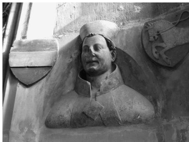
Arnoštova busta z dílny Petra Perlře na triforiu katedrály sv. Víta

Arnošt prožil důležité životní období mládí, kdy se formuje a dotváří osobnost člověka, v severní Itálii na univerzitách v Bologni a Padově, v tehdejší Evropě těch nejlepších škol pro římské a kanonické právo, obor propojený jak s antickým dědictvím tak teologií, jehož význam tehdy stále vzrůstal. Zvláště první z obou univerzit, bolognská, byla již od 13. století vnitřně spojena s římskou kurií, pro niž tvořila intelektuální zázemí. Ke kurií, ve 14. století již sídlící v Avignonu, Arnošt v posledních letech svých studií odešel, aby vysokou úroveň svých