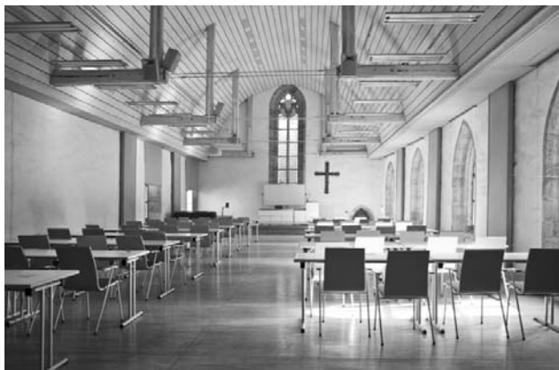
Přednášková síň Coelicum

Teologická fakulta nesídlí na univerzitním kampusu na okraji města, ale ve svých původních krásných gotických prostorách v těsném sousedství katedrály. V r. 1952, tedy krátce po vzniku NDR, tu bylo založeno Filosoficko-teologické studium, jediné svého druhu, které zajišťovalo vzdělání pro kandidáty kněžství. Dodnes jde o jedinou katolickou teologickou fakultu na území bývalé NDR. Teprve v r. 2003 byla včleněna do svazku univerzity Erfurt. S dvanácti profesory, ke kterým je přičleněn průměrně jeden asistent (doktorand), a s relativně nízkým počtem studentů jde o fakultu vyloženě rodinného typu.