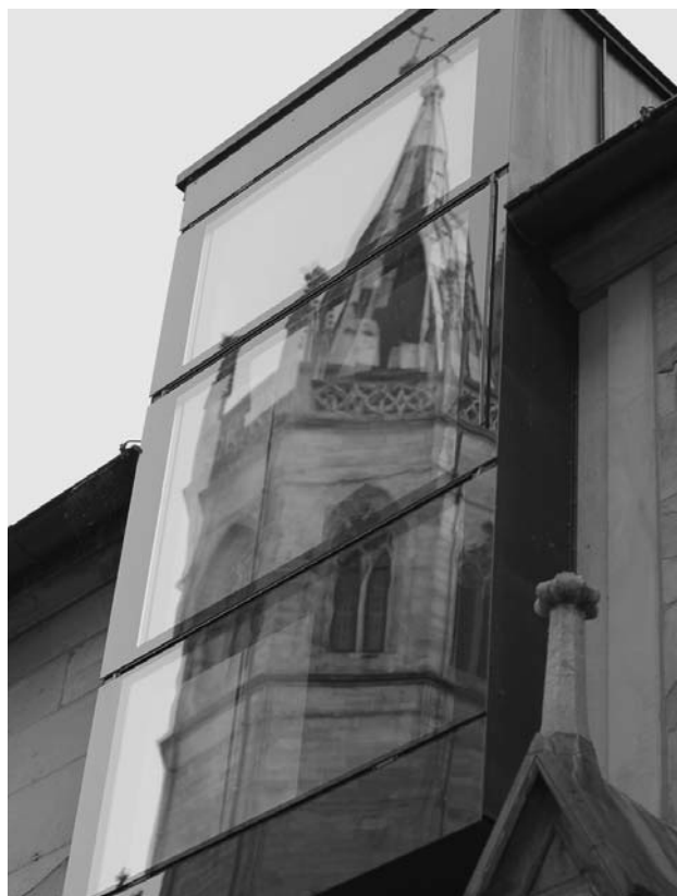
Budova Katolické teologické fakulty v Erfurtu