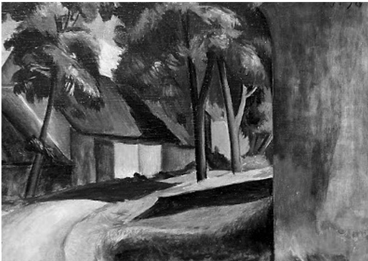
Alfred Justitz, Krajina / Pohled na dům a stromy