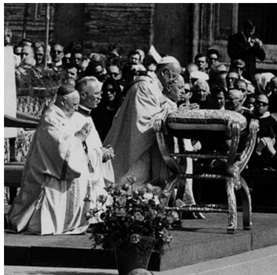
Kanonizace Jana Nepomuckého Neumanna