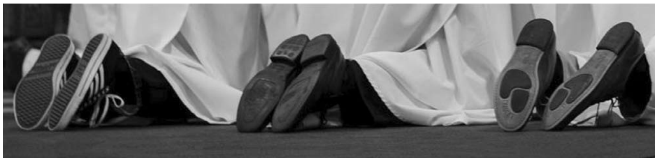
(Člověka víra)