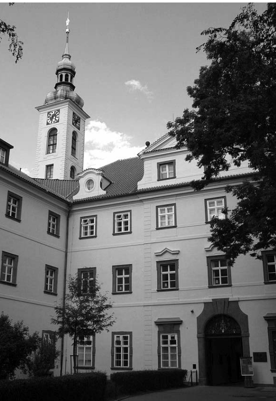
Nádvoří pražského Klementina

Z Katalogu posluchačů teologické fakulty Karlo-Ferdinandovy univerzity z r. 1835